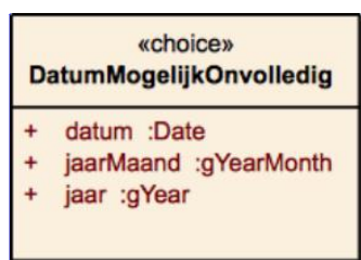
Afbeelding 1. UML class diagram voor het complex type DatumMogelijkOnvolledig